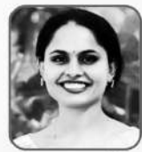
സോന മൈക്കിൾ സംസ്ഥാന സിൻഡിക്കേറ്റ് അംഗം