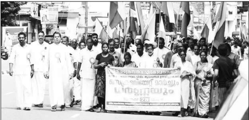
ദളിത് ക്രൈസ്തവ സെക്രട്ടറിയേറ്റ് മാർച്ചും ധർമ്മയും