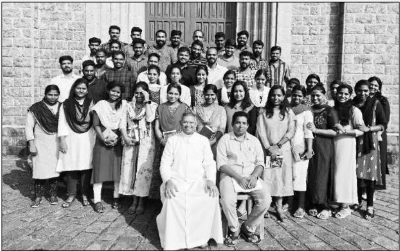
പ്രിമാര്യേജ് കോഴ്സ് ഡിസംബർ 2023