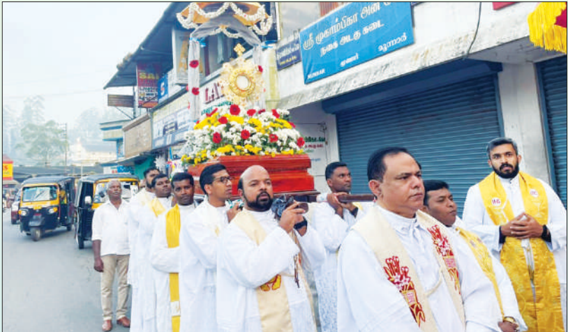
ദിവ്യകാരൂണ്യ വർഷത്തിന്റെ സമാഹരണം - മൂന്നാർ സോൺ