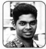
റൈസ് ബെബാസ്റ്റൻ സെക്രട്ടറി