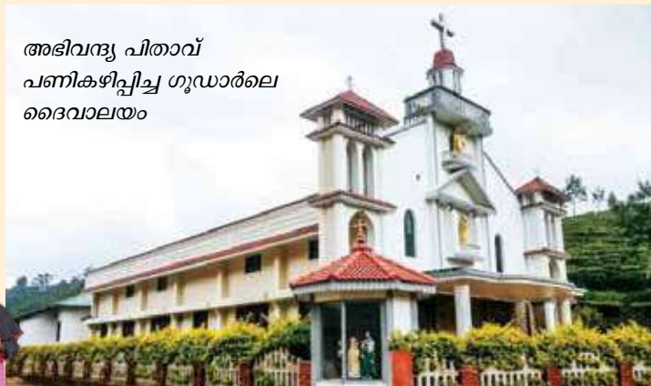
അഭിവന്ദ്യ പിതാവ് പണികഴിപ്പിച്ച ഗുഡാർലെ ദൈവാലയം