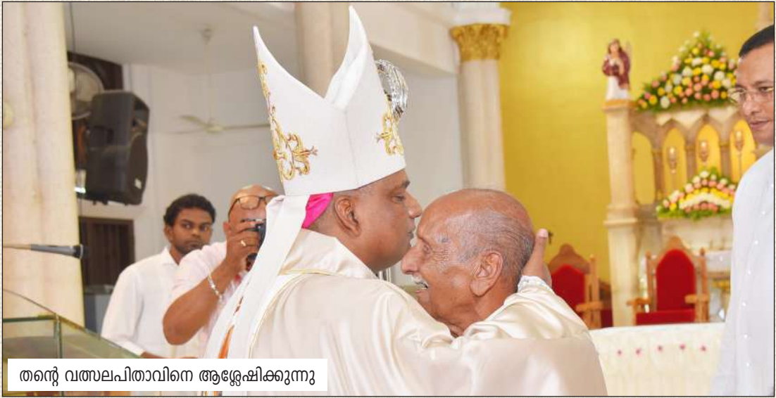
തന്റെ വത്സലപിതാവിനെ ആശ്ലേഷിക്കുന്നു