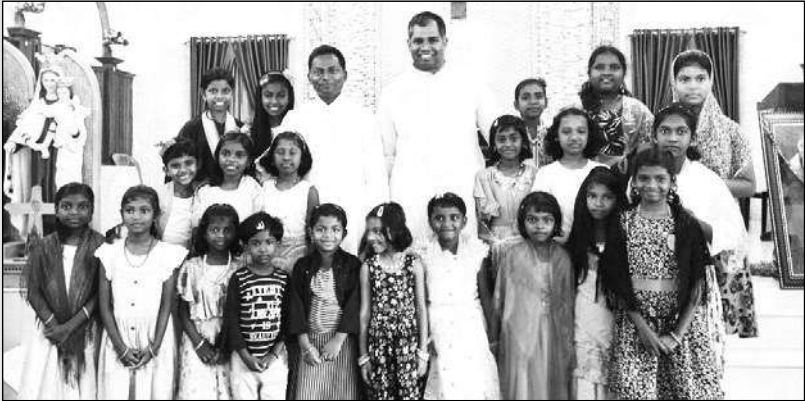
ബാലികാദിനാചരണം മൗണ്ട് കാർമ്മൽ ചർച്ച്, ആണ്ടൂർ