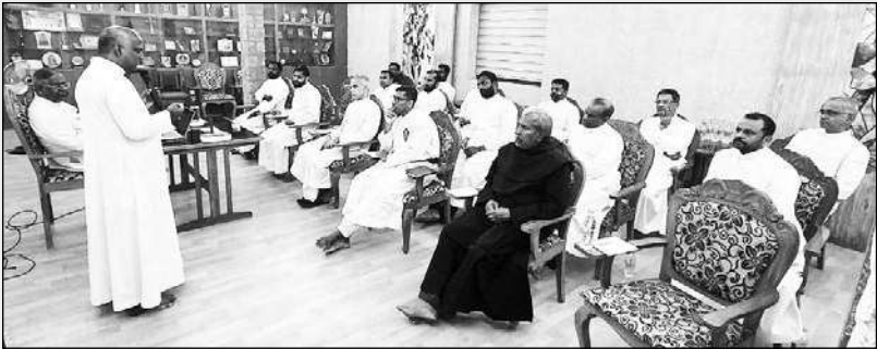
രുപതയിലെ ഇടവകയിൽ ശുശ്രൂഷ ചെയ്യുന്ന സന്യാസ്ത വൈദികരുടെ ഒരു മീറ്റിംഗ് ബിഷപ്പ്സ് ഹൗസിൽ