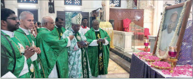
ബിഷപ്പ് പീറ്റർ അനുസ്മരണ ദിവ്യബലി