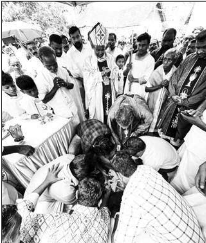
അടിസ്ഥാന ശിലാസ്ഥാപനം -തറകല്ലിടൽ ജോൺ ടി ബാപ്റ്റിസ്റ്റ് ദൈവലയം വേളൂർ