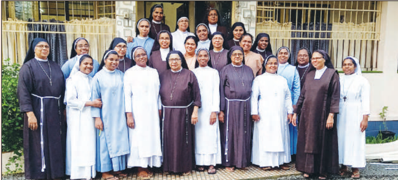
സന്യസ്ത സംഗമം - മുണ്ടക്കയം മേഖല