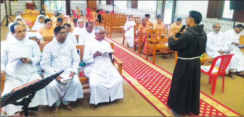
കേരള സഭ നവീകരണ പരിപാടിയുടെ ഭാഗമായി പട്ടിത്താനം ഫൊറോനയിൽ നടത്തപ്പെട്ട എവുക്കരിസ്റ്റാ-23 എന്ന വൈദിക-സന്യസ്ത സെമിനാറിൽനിന്നും.