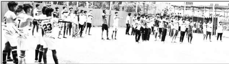
സജീവം ഫുട്ബോൾ ടൂർണമെന്റ് പ്രതിജ്ഞ