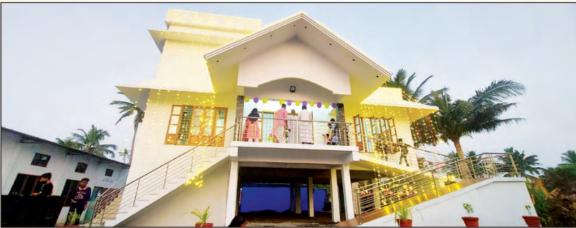
പുതിയതായി നിർമ്മിച്ച നെടുമുടി വൈദികവസതി ആശീർവാദം