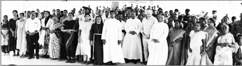
അഭിവന്ദ്യ പിതാവ് വീഷെയാർ കുടുംബാംഗങ്ങളോടൊപ്പം