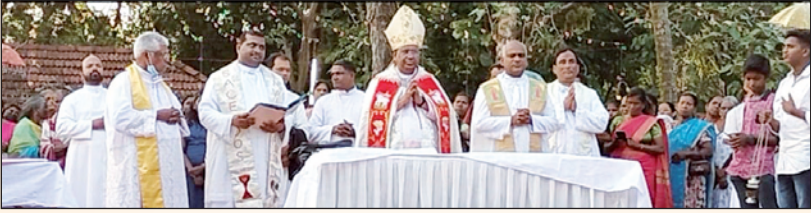
ഇലയ്ക്കാട് ഓഡിറ്റോറിയം ആശീർവാദം