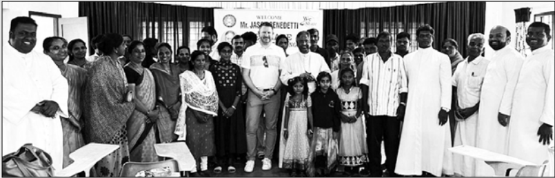
വീ-ഷെയാർ സംഗമം - കുട്ടിക്കാനം