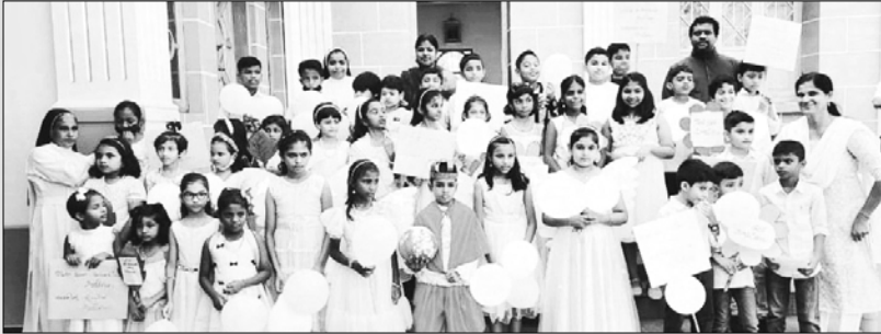
കോട്ടയം ഗുഡ്ഷേപ്പേർഡ് ഇടവകയിൽ തിരുബാലസഖ്യ ദിനാചരണം