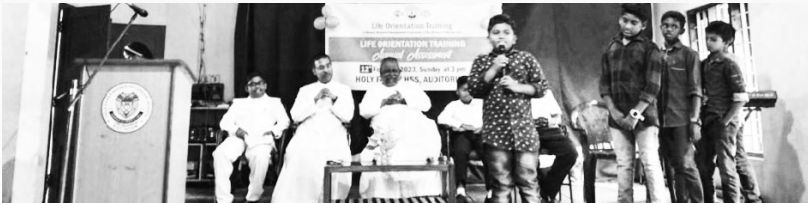
ലെഫ് ഓറിയന്റേഷൻ ട്രെയിനിംഗ് 2022-2023 ആദ്യബാച്ച്