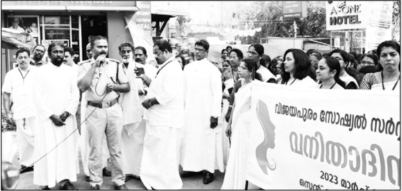
വനിതാദിനാഘോഷം ഫ്ളാഗ് ഓഫ് ചെയ്യുന്നു