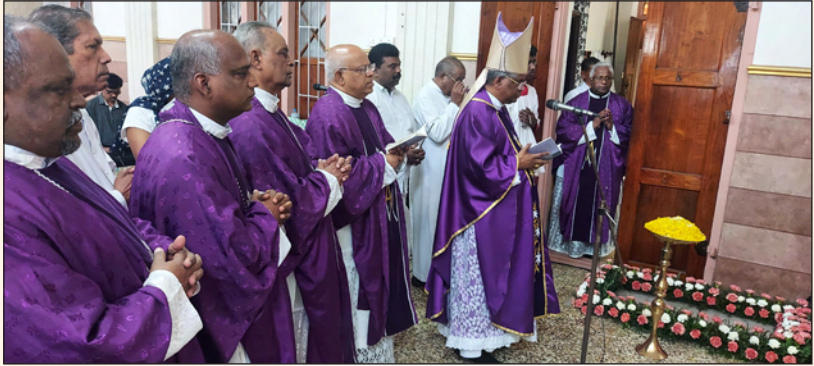
അഭിവന്ദ്യ ബൊനവന്തുരാ അരാനാ പിതാവിന്റെ അനുസ്മരണബലി