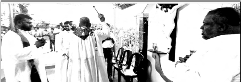
കുന്നുംഭാഗം സെമിത്തേരി വെഞ്ചരിപ്പ്

കരയുന്ന മനുജാ നിന്നെ നോക്കി ഉയരങ്ങളിൽ വാഴുമേശുനാഥൻ അലിവാർന്നിടേണം നിന്നുള്ളമെന്നുള്ളിൽ കരുതിതൻ ചുടുചോര ചിന്തി. മണ്ണിൽ അലിവാർന്നു തെല്ലുമേ കണ്ടതില്ല അധി കഠിനമായ്തീർന്നുവോ നിൻ ഹൃദയം സ്നേഹം നടിച്ചു നിൻ സ്നേഹിതൻ നെഞ്ചിൽ ആഴത്തിലാഴ്ത്തി നിൻ വാൾ മുനകൾ വേർപ്പിൻ കണങ്ങളാൽ ജ്ഞാനം പകർന്നൊരാ താതന്റെ വാക്കുകൾ പുഷ്പമായി തൻ നിണത്തുള്ളികൾ അമ്മിഞ്ഞപ്പാലാക്കി- പ്പോറ്റിയോരമ്മേത്തരുവിലാക്കി കൂടെ ശയിപ്പവർ തമ്മിൽപ്പരസ്പരം നാവൊന്നനക്കീട്ടു നാളേറെയായ് നാവൊന്നനക്കിയാലാരാമമധ്യത്തിലാ ടുന്ന പൂക്കൾ തളർന്നുവീഴും ഉന്മാദ വസ്തുക്കളെല്ലാം നുകർന്നി- ട്ടുൻലാദ നൃത്തച്ചുവടു വപ്പു പെരുകുന്നു തിന്മകളോരോന്നുമീ വണ്ണ- മുരുകുന്നു മനമിന്നു ക്രിസ്തുവിന്റെ ഇത്യാദി തിന്മകളുള്ളിലൊളിപ്പിച്ച് നോമ്പിനെപ്പുൽകുന്നു മാന്യമായി തിന്മകൾ സർവ്വം ത്വജിക്കണം നോമ്പിനാൽ മത്സ്യവും മാംസവും മാത്രമല്ല പശ്ചാത്തപിച്ചിന്ന് നോമ്പ് നോറ്റീടുകിൽ കർത്താവു പാപം പൊറുക്കുമല്ലോ.