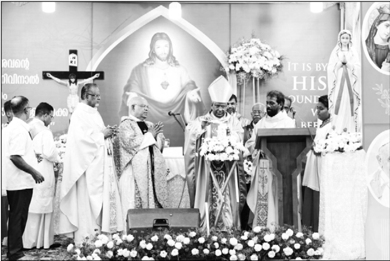
മാരാമൺ കരിസ്താറ്റിക് കൺവൻഷൻ അഭിവന്ദ്യ സെബാസ്റ്റ്യൻ പിതാവ് ഉദ്ഘാടനം ചെയ്യുന്നു