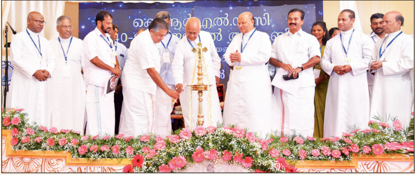
കെ.ആർ.എൽ.സി.സി. 40-ാം ജനറൽ അസംബ്ലി കേരള ഫിഷറീസ് വകുപ്പ് മന്ത്രി ശ്രീ. സജി ചെറിയാൻ ഉദ്ഘാടനം ചെയ്യുന്നു