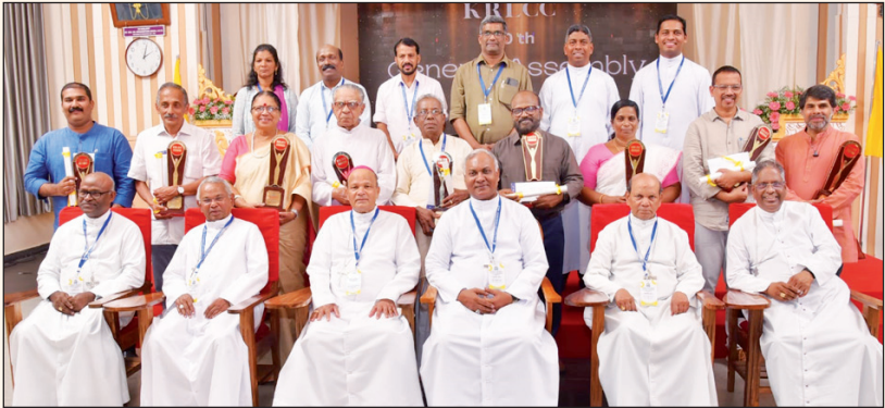
കെ.ആർ.എൽ.സി.സി. അവാർഡ് ജേതാക്കൾ