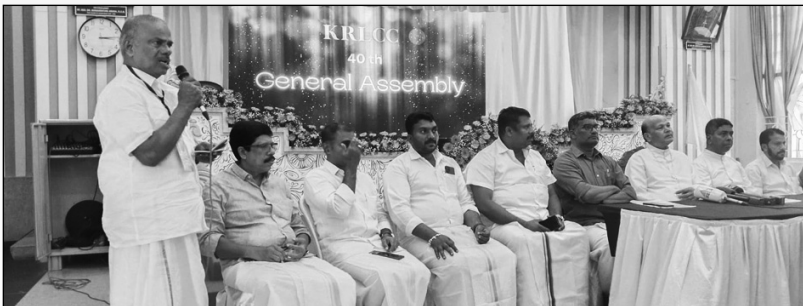
കെ.ആർ.എൽ.സി.സി. അസംബ്ലിയുടെ സമാപനത്തിനുശേഷം നടന്ന പത്രസമ്മേളത്തിൽ നിന്ന്