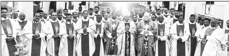
SIP യുടെ 17-ാം ദേശീയ കോൺഗ്രസ് വിമലഗിരിയിൽ