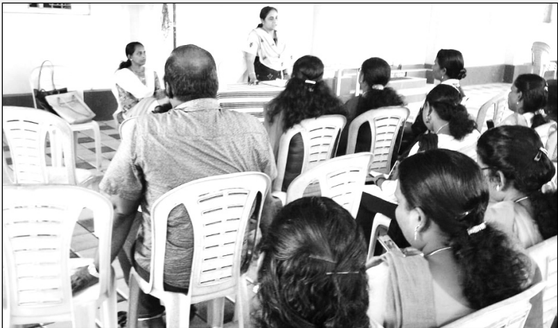
ആശാകിരണം സന്നദ്ധപ്രവർത്തകയോഗം- കോട്ടയം