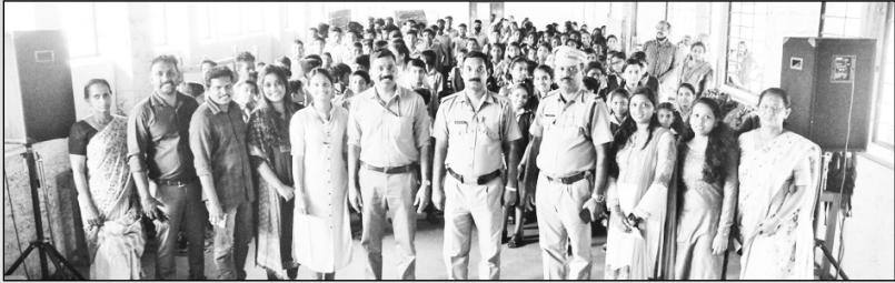
ചെൽഡ്ലെൻ ഓപ്പൺ ഹൗസ്- പാല