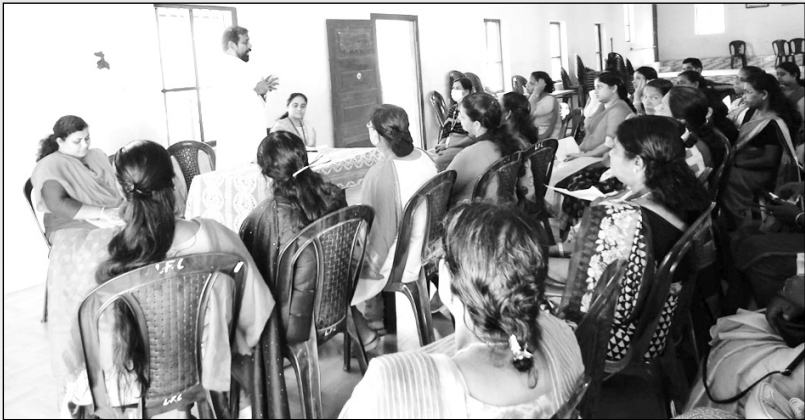
ആശാകിരണം സന്നദ്ധപ്രവർത്തകയോഗം- തിരുവല്ല