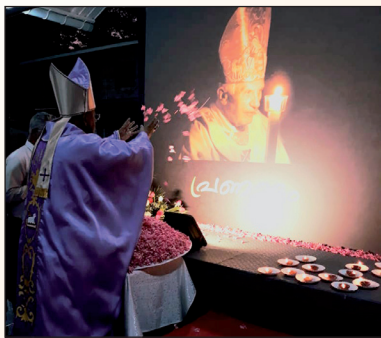
വിമലഗിരിയിൽ നടന്ന പരി. പിതാവ് ബെനഡിക്ട് പതിനാറാമൻ പാപ്പായുടെ അനുസ്മരണം