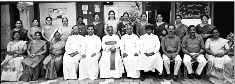
വിജയപുരം കോർപ്പറേറ്റ് ഏഡ്യൂക്കേഷൻ ഏജൻസിയിൽ നിന്നും വിരമിക്കുന്ന അധ്യാപകർ അഭി. പിതാവിനോടും മാനേജരോടുമൊപ്പം