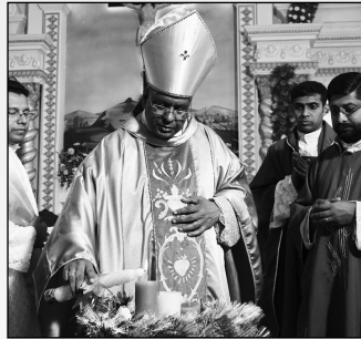
അഭി. സെബാസ്റ്റ്യൻ പിതാവ് ആഗമനകാല റീത്തിൽ ആദ്യ തിരി തെളിക്കുന്നു