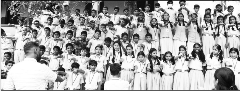
ലഹരി വിരുദ്ധ പ്രതിജ്ഞ