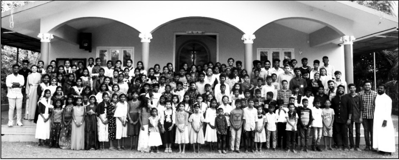
ചെങ്ങളം സെന്റ് ജോസഫ്സ് ഇടവകയിൽ നടന്ന ക്രിസ്റ്റീൻ ധ്യാനം