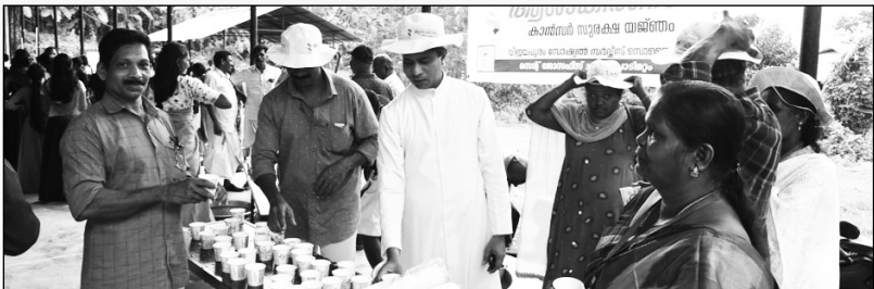
പായസ വില്പന പൊടിമറ്റം