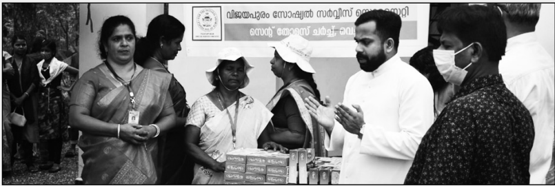
പായസ വില്പന- വെച്ചുച്ചിറ