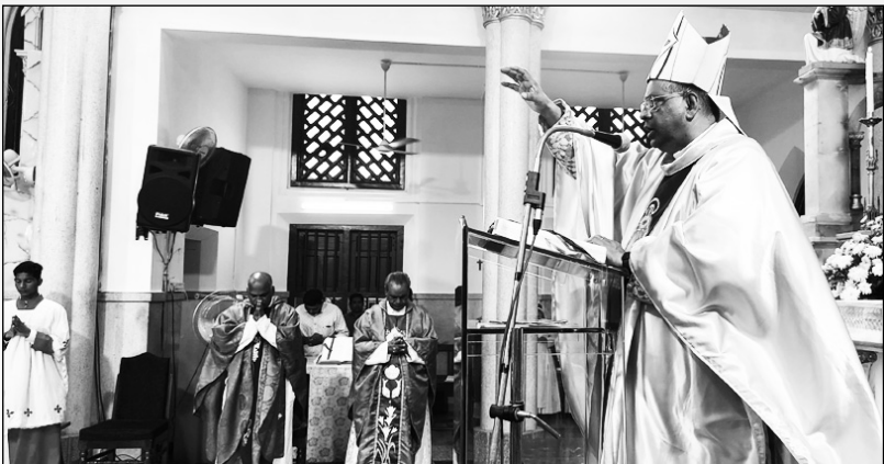
കേരള സഭാ നവീകരണ യത്നത്തിന്റെ ഭാഗമായി രൂപതയെ മുഴുവനും അഭി. പിതാവ് വിമലഹൃദയത്തിനു പ്രതിഷ്ഠിക്കുന്നു