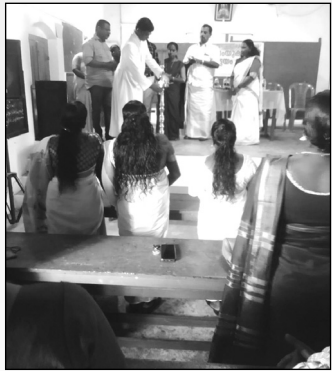
സംയുക്ത യോഗം വി.എസ്.എസ്.എസ്. ഡയറക്ടർ ഉദ്ഘാടനം ചെയ്യുന്നു.