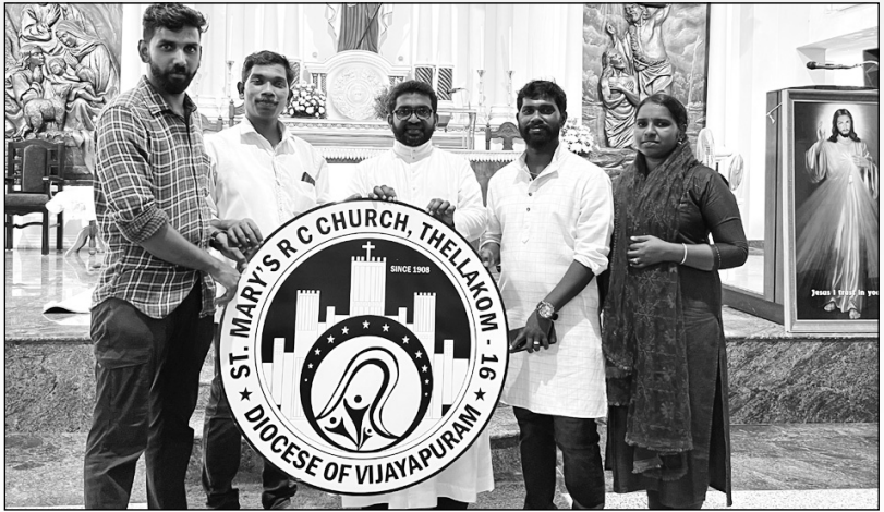
സെന്റ് മേരീസ് തെള്ളകം പള്ളിയിൽ ഇടയസന്ദർശനത്തോടനുബന്ധിച്ച് പള്ളിയുടെ ലോഗോ പ്രകാശനം