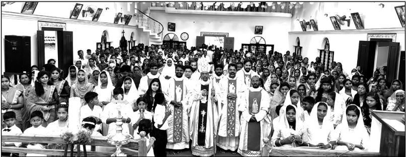
അരണക്കൽ ഇടവക ശതാബ്ദിസമാപനം