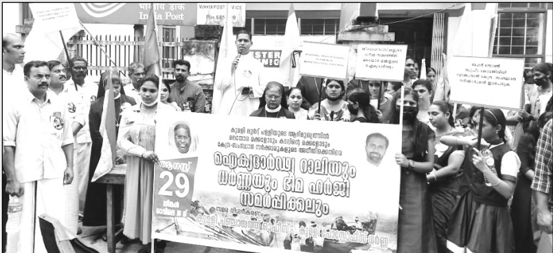
വിഴിഞ്ഞം സമരത്തിന് ഐക്യദാർഢ്യം പ്രഖ്യാപിച്ചുകൊണ്ട് കുമളി ഇടവക റാലി നടത്തിയപ്പോൾ