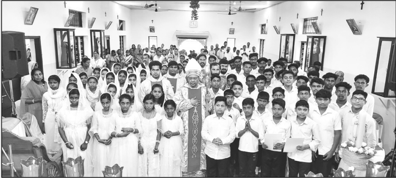
ഇടവക സന്ദർശനനവും സൈമര്യലേപനകർമ്മവും കട്ടപ്പന സെന്റ് ജോസഫ് ദൈവാലയത്തിൽ