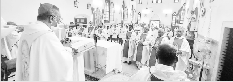
മൗണ്ട്കാർമ്മൽ തിരുനാൾ മിണ്ടാമാത്തിൽ