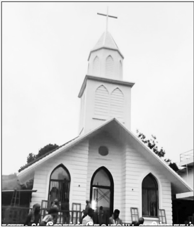
നവീകരിച്ച വാളാർഡി, സെന്റ് ജോർജ്ജ് ദൈവാലയം