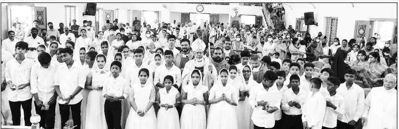
തിരുവല്ല സൈന്ധവ്യലേപന കർമ്മം