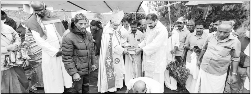
കരടിക്കുഴി ദൈവാലയത്തിന്റെ ശിലാസ്ഥാപനകർമ്മം