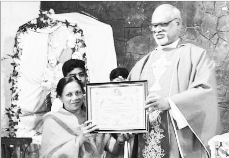
ബെസറ്റ് സൺഡേ സ്കൂൾ ഡി ഗ്രൂപ്പ് - ഉപ്പുതറ