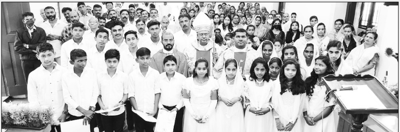
കല്ലാർ വട്ടിയാർ സൈന്ധവ്യലേപന കർമ്മം