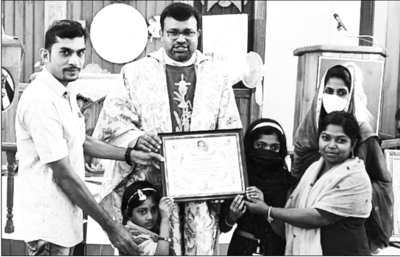
ബെസ്റ്റ് സൺഡേ സ്കൂൾ സി ഗ്രൂപ്പ് - ചാത്തൻതറ