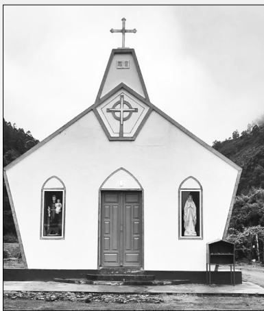
നവീകരിച്ച അരുവിക്കാട് സെന്റ് തെരേസാസ് ദൈവാലയം