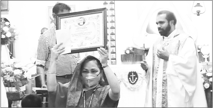
ബെസറ്റ് സൺഡേ സ്കൂൾ എ ഗ്രൂപ്പ് - കുമളി